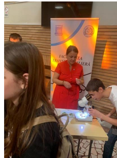
Figura 3. Noaptea Cercetătorilor Europeni, 2022 – Facultatea Transfrontalieră.