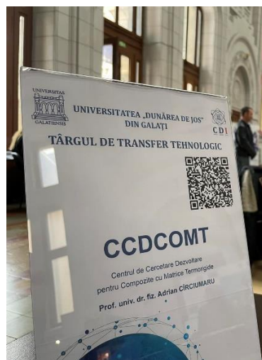
Figura 1. Centrele de cercetare ale Facultății Transfrontaliere