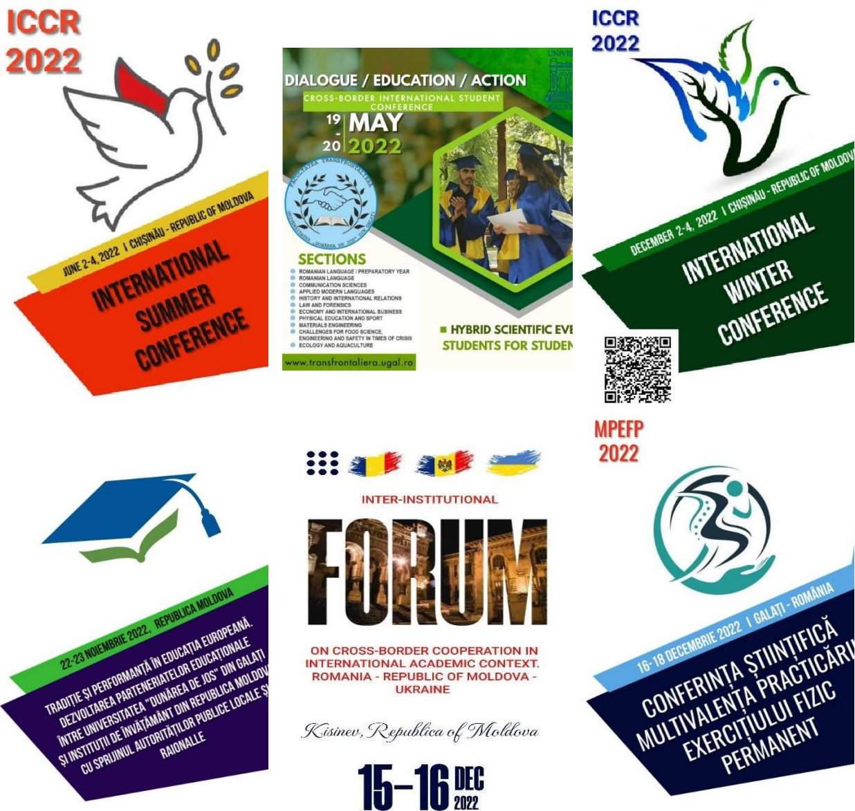
Figura 2. Evenimente științifice organizate de Facultatea Transfrontalieră în 2022.

Cercetarea este susținută, pe de o parte din fondurile provenite din finanțarea ministerială, iar pe de altă parte din veniturile proprii ale universității, respectiv proiectele și granturile câștigate prin competiții naționale / europene. Prin aceste trei axe de finanțare au fost susținute publicații științifice (articole științifice: ISI, BDI; cărți și capitole în cărți internaționale și naționale, traduceri și dicționare), participările la conferințe internaționale și naționale, precum și organizarea a numeroase evenimente științifice (conferință, simpozion, forum, conferință internațională studențească - Figura 2, Noaptea Cercetătorilor Europeni – Figura 3).